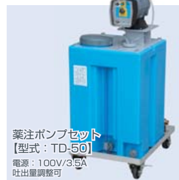
薬注ポンプセット 【型式: TD-50】 電源: 100V/3.5A 吐出量調整可